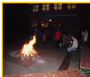
Abenteuer und Entspannung gehören für uns zusammen!

Kostenfreie Angebote gibt es auch, insbesondere wenn diese z.B. vom Förderverein St. Agnes oder anderen Sponsoren gefördert bzw. bezuschusst werden.