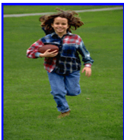
Aktive Kinder brauchen aktive und interessierte Väter!

Im Rahmen unserer pädagogischen Arbeit mit Eltern liegt uns die Zusammenarbeit mit Vätern besonders am Herzen.